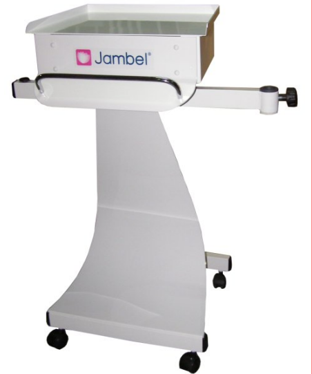
Coluna CA2 Ref. 0167

O MODULE MDL06 é um aparelho fabricado por método tecnológico de integração electrónica, o qual, permite reunir várias funções para a execução de diversos tratamentos de rosto. Sendo um aparelho funcional, torna-se uma opção prática e económica para qualquer Gabinete de Estética.